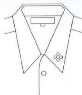
ラインストーン付き