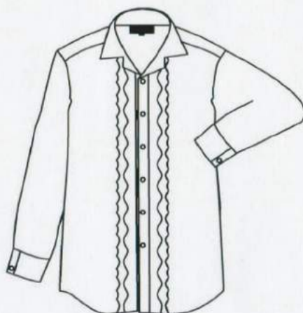
前にひだ・フリルが 入ったシャツ